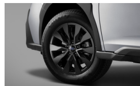
18-дюймовые легкосплавные диски