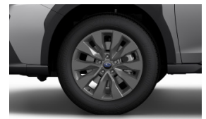
18-дюймовые легкосплавные диски

1. Указанные цены являются максимальными ценами перепродажи и наличие опций, указанные в комплектациях могут изменяться без предварительного уведомления, так как сведения о ценах и комплектациях носят исключительно информационный характер.